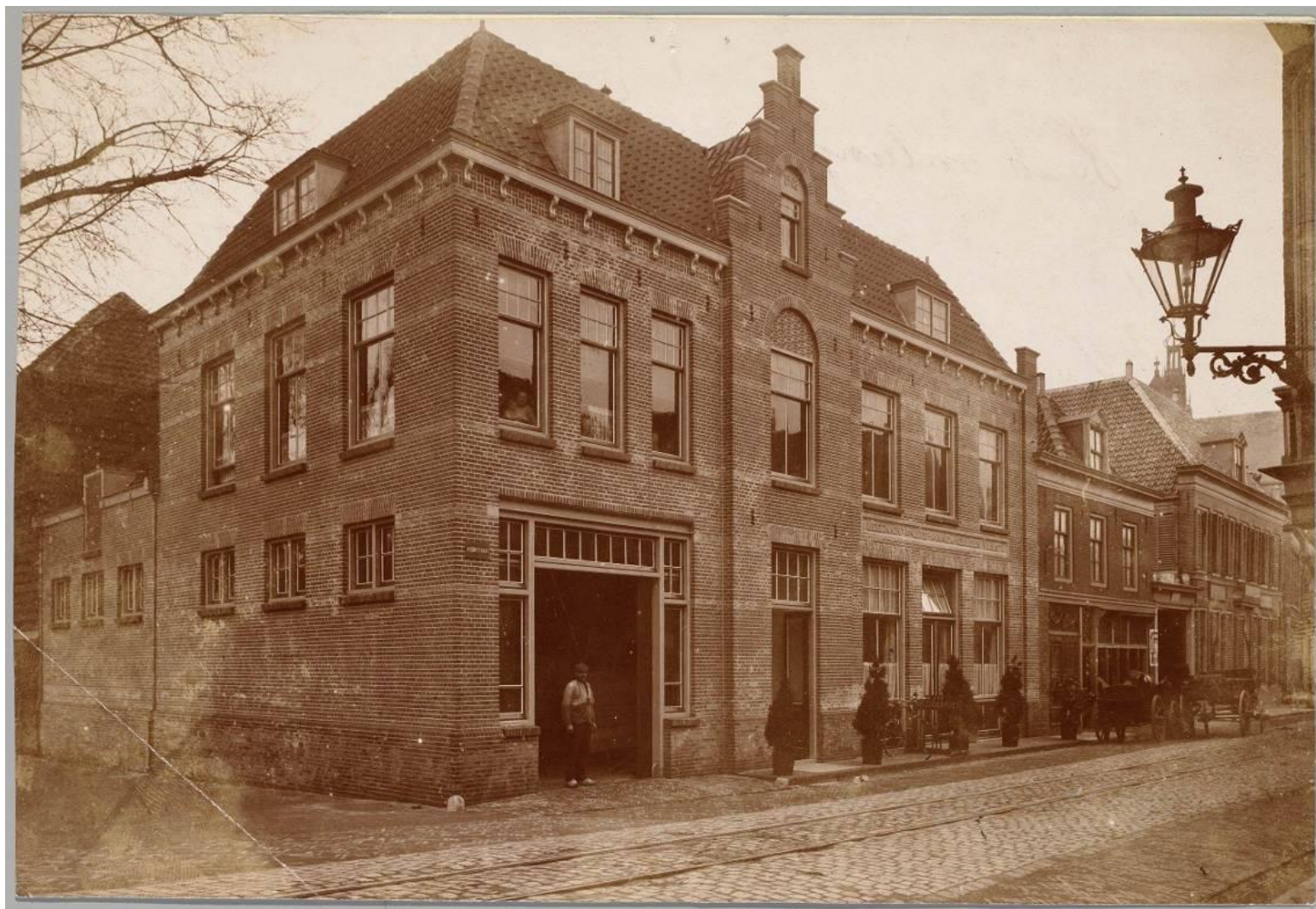
Het Gulden Vlies na de verbouwing van 1907. Herberg en paardenstal onder één dak.

Een ploeg waarin ze alle vertrouwen hebben dat die er op de Koorstraat een succesvol bedrijf van gaat maken. Een mix van jonge honden en ervaren krachten.